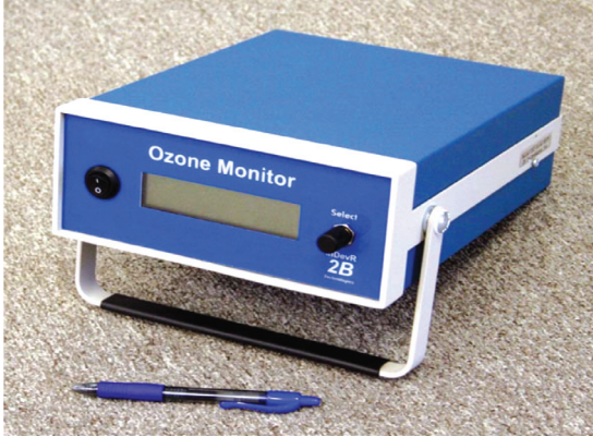
Model : 202