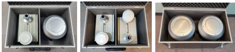
휴대용 케이스 종류