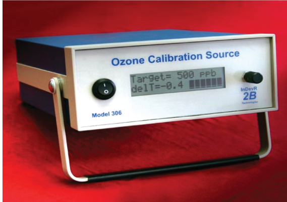
Model : 306