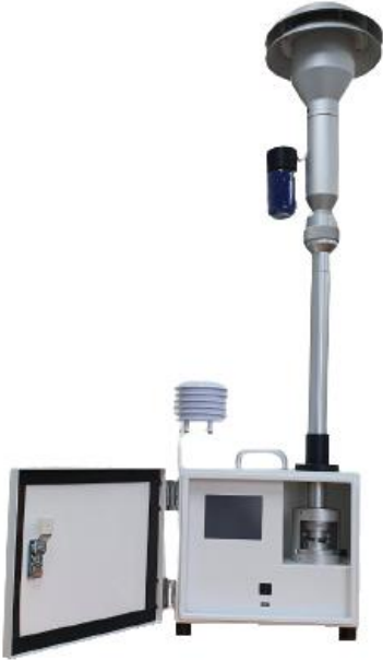
Model : LAS-1