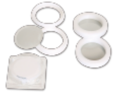
47mm - Teflon Filter